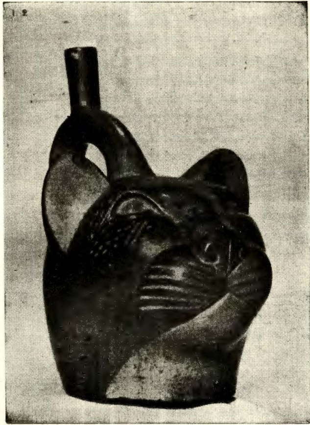
Cabeza de Puma.—Alfarería Muchik, 2. a época.