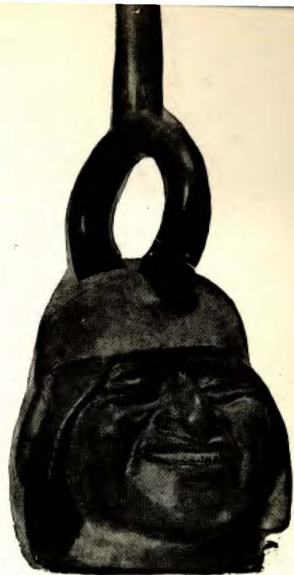
Cabeza humana.—Alfarería Muchik, 2.ª época. Museo Arqueológico Peruano.

(3) Llamam así hoy los indios del litoral a unos haces de enea o de totora que flotan en el agua y sobre los cuales se aventuran en el mar.