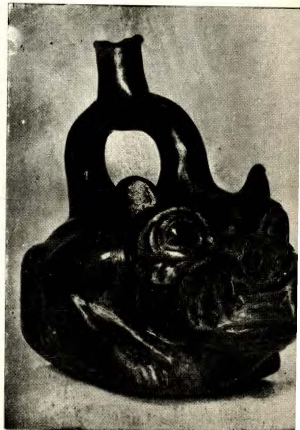
Sapo.—Alfarería Muchik, 2.ª época.