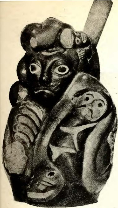
Idolo jaguar.—Alfarería Muchik. 2.ª época. Museo Arqueológico Peruano,